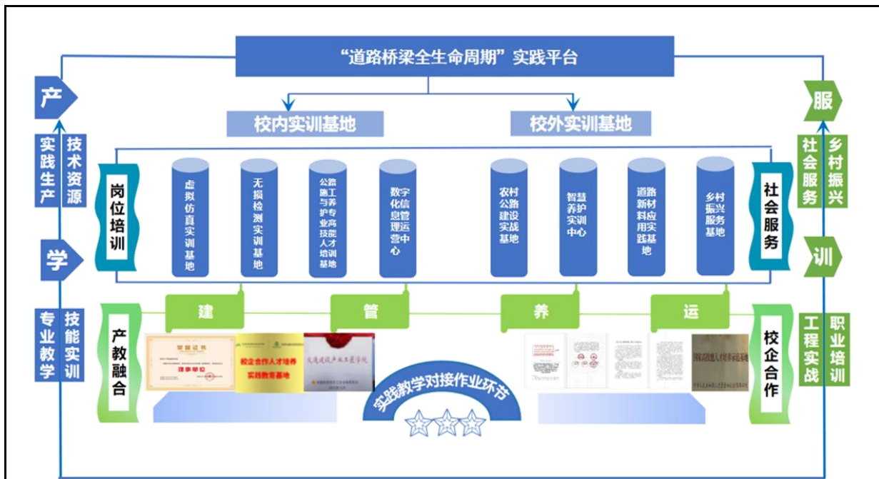
图 3：“道路桥梁工程全生命周期”实践平台